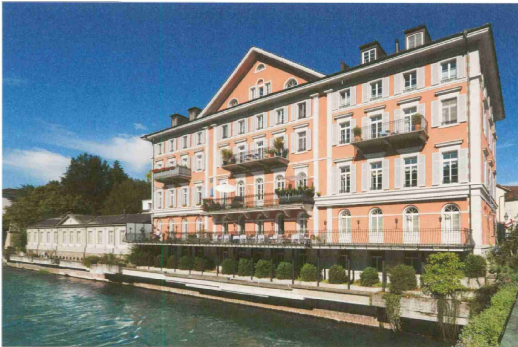
Direkt am Wasser: Die elegante Fassade des Hotel Limmathof Baden.